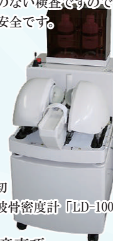
世界初 超音波骨密度計「LD-100」