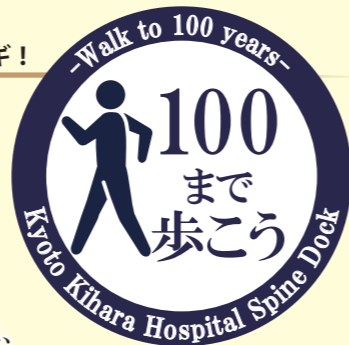
京都木原病院 脊椎ドックエンブレム

人生100年時代と言われていますが、最期の10~15年は、車椅子や寝たきり状態という生活の質の低下が、大きな社会問題になっています。その原因の大きな一つは、現代の生活スタイルの変化です。